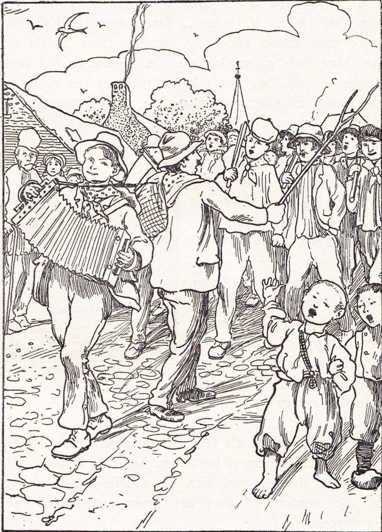
En vertrekken onze werklieden naar Frankrijk (bl. 69.)

Bier speelt eene voorname rol. Is eene doopplechtigheid afgelopen,