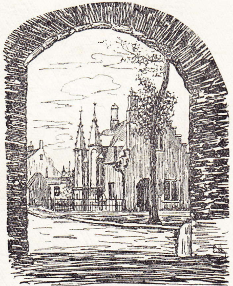
Huis van den sluiswachter.

't Gentsche, zelfs het Kortrijksche begijnhof, toont meer de tegenstelling tusschen beweging en rust. Vooral in eerstgenoemde stad komt men onmiddellijk uit eene overvolle straat in die rustige wijk, waar men nauwelijks een sleependen stap hoort, eene fluisterende stem verneemt, eene vage schim ontdekt. Maar, toen wij 't Brugsche begijnhof verlieten en, door de verlaten straten, naar 't hart der stad terugkeerden, was het of wij uit een klein in een groot begijnhof kwamen.